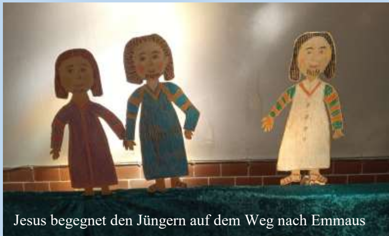
Jesus begegnet den Jüngern auf dem Weg nach Emmaus

Wir hören auf Geschichten aus der Bibel und verabschieden die schulpflichtigen Tabor-Kita-Kinder, anschließend von 15-18 Uhr ist Sommerfest in den Höfen der Taborkirche. Alle sind herzlich eingeladen